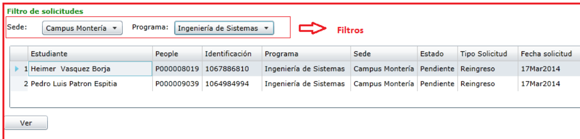
Figura 4. Filtros de solicitud

3. Filtro de solicitudes. Permite realizar filtros sobre los registros de solicitudes. Estos pueden ser por Sede o por Programas específicos. Observe la figura 4.