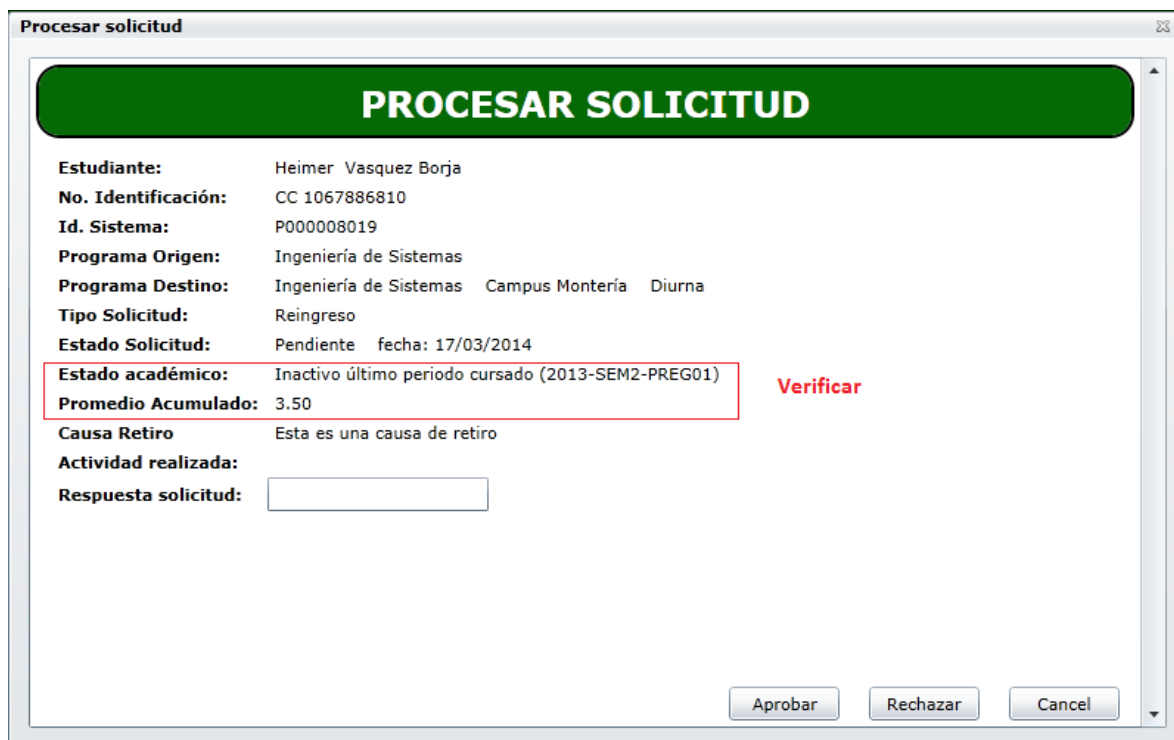
Figura 5. Vista detallada de la solicitud.

Una vez se tenga el listado de solicitudes, se selecciona una solicitud en particular y se presiona el botón de comando “Ver”. Le mostrara una ventana emergente con información detallada dela solicitud. Ver figura 5.