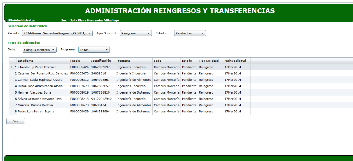
Figura 1. Entorno de aplicación de Administración reingresos y transferencias.

El entorno del aplicativo se ilustra en la figura 1.