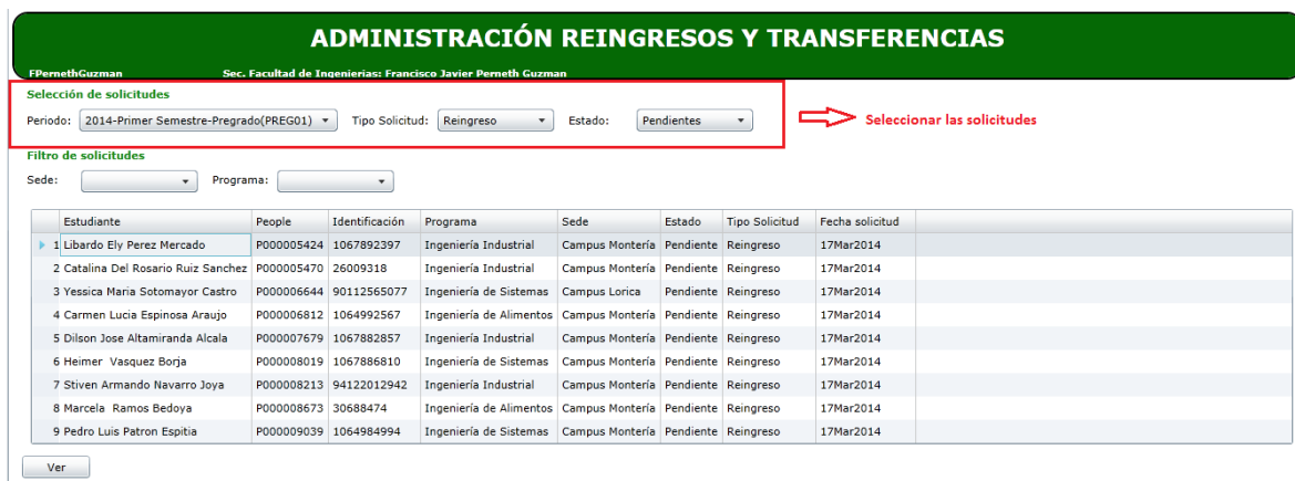
Figura 3. Selección de solicitud

Es el primer paso para administrar las solicitudes. Seleccione el Periodo académico, tipo de solicitud y el estado. Ver figura 3.